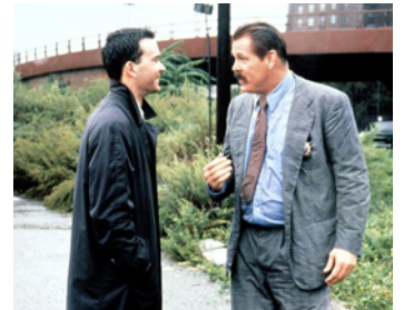
1990 CONTRE-ENQUÊTE (Q and A) de Sidney Lumet avec Timothy Hutton