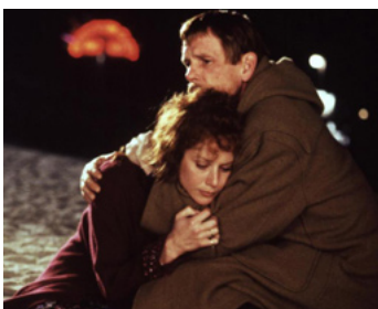
1990 CHACUN SA CHANCE (Everybody wins) de Karel Reisz avec Debra Winger