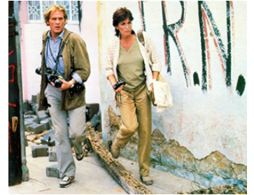
1983 UNDER FIRE (Under Fire) de Roger Spottiswoode avec Joanna Cassidy