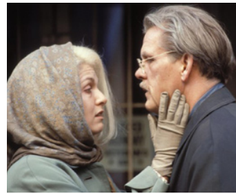
1996 MOTHER NIGHT (Mother Night) de Keith Gordon avec Sheryl Lee