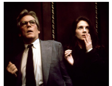
1994 LES COMPLICES (I love Trouble) de Charles Shyer avec Julia Roberts