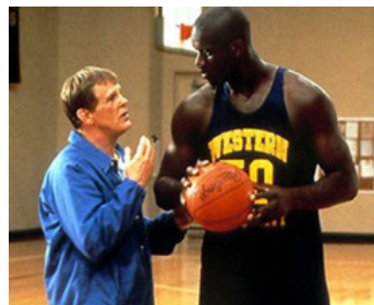
1994 BLUE CHIPS (Blue Chips) de William Friedkin avec Shaquille O'Neal