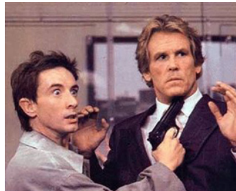
1989 LES TROIS FUGITIFS (Three Fugitives) de Francis Veber avec Martin Short