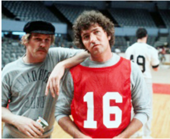
1979 NORTH DALLAS FORTY de Ted Kotcheff avec Mac Davis