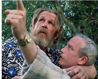
1986 LE CLOCHARD DE BEVERLY HILLS (Down and out in Beverly Hills) de P. Mazursky avec R. Dreyfuss