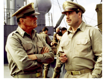
1998 LA LIGNE ROUGE (The Thin Red Line) de Terrence Malick avec John Travolta