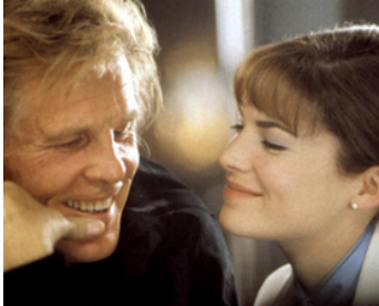
1997 L'AMOUR... ET APRÈS (Afterglow) d'Alan Rudolph avec Lara Flynn Boyle