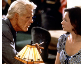
2000 TRIXIE (Trixie) d'Alan Rudolph avec Emily Watson