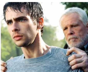
2006 LE GUERRIER PACIFIQUE (Peaceful Warrior) de Victor Salva avec Scott Mechlowicz