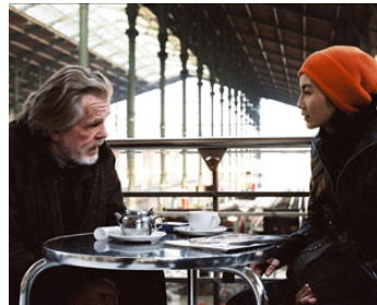
2003 CLEAN d'Olivier Assayas avec Maggie Cheung