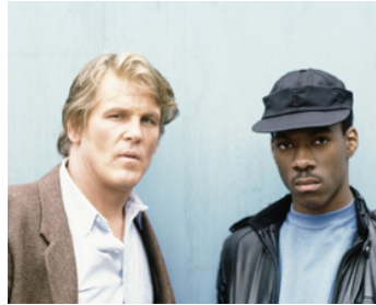
1982 QUARANTE HUIT HEURES (48 Hours) de Walter Hill avec Eddie Murphy