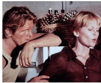
1978 LES GUERRIERS DE L'ENFER (Who'll stop the Rain) de Karel Reisz avec Tuesday Weld