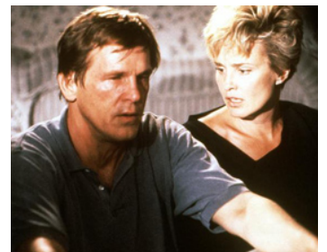
1991 LES NERFS À VIF (Cape Fear) de Martin Scorsese avec Jessica Lange