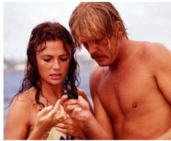
1977 LES GRANDS FONDS (The Deep) de Peter Yates avec Jacqueline Bisset