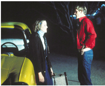
1975 RETOUR TO MACON COUNTY de Richard Compton avec Laura Sayer