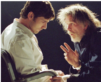
2002 HULK (The Hulk) d'Ang Lee avec Eric Bana