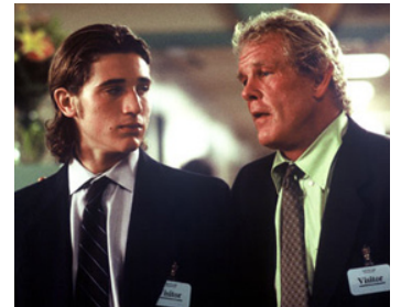
2006 OFF THE BLACK (Off the Black) de James Ponsoldt avec Trevor Morgan