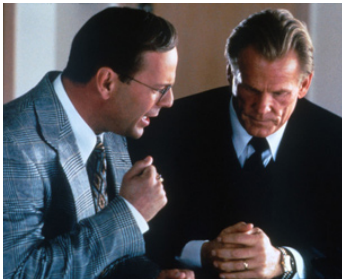
1998 BREAKFAST OF CHAMPIONS d'Alan Rudolph avec Bruce Willis