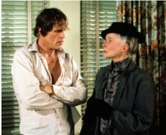
1984 GRACE QUIGLEY (Grace Quigley) d'Anthony Harvey avec Katharine Hepburn