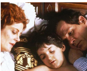
1992 LORENZO (Lorenzo 'Oil) de George Miller avec Zack O'Malley Greenburg, S. Sarandon