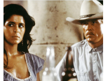
1987 EXTRÊME PRÉJUDICE (Extreme Prejudice) de Walter Hill avec Maria Conchita Alonso