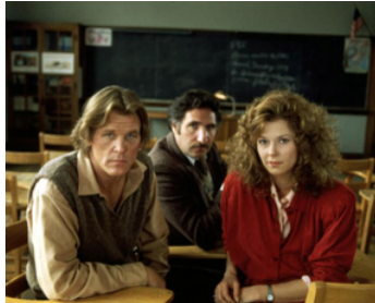
1984 RAS LES PROFS ! (Teachers) d'Arthur Hiller avec Judd Hirsch, JoBeth Williams