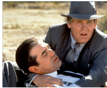
1995 LES HOMMES DE L'OMBRE (Mulholland Falls) de Lee Tamahori avec Chazz Palminteri