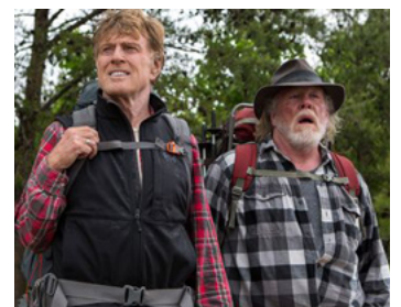
2015 PROMENADE DANS LES BOIS (A Walk in the Woods) de Ken Kwapis avec Robert Redford