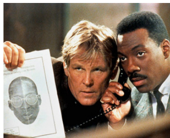
1990 48 HEURES DE PKLUS (Another 48 Hours) de Walter Hill avec Eddie Murphy