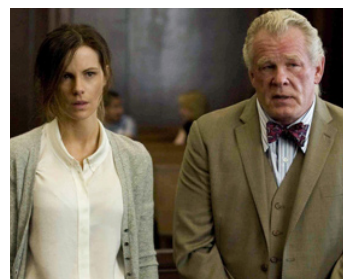
2013 MENSONGES ET FAUX SEMBLANTS (Cate McCall) de K. Moncrieff avec Kate Beckinsale