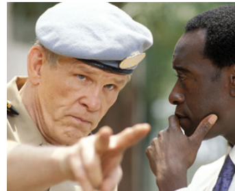
2004 HÔTEL RWANDA (Hotel Rwanda) de Terry George avec Don Cheadle