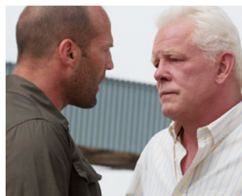
2013 PARKER (Parker) de Taylor Hackford avec Jason Stratham