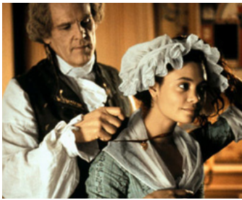
1995 JEFFERSON À PARIS (Jefferson in Paris) de James Ivory avec Thandie Newton