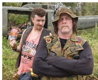
2008 TONNERRE SOUS LES TROPIQUES (Tropic Thunder) de Ben Stiller avec Danny McBride