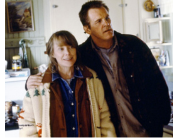
1998 AFFLICTION (Affliction) de Paul Schrader avec Sissy Spacek