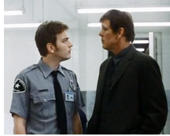
1998 LE VEILLEUR DE NUIT (Nightwatch) d'Ole Bornedal avec Ewan McGregor