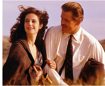
1982 CANNERY ROW (Cannery Row) de Davis S. Ward avec Debra Winger