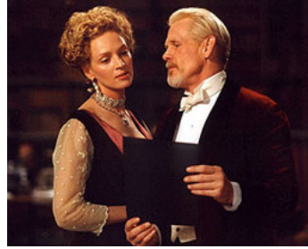
2000 LA COUPE D'OR (The Golden Bowl) de James Ivory avec Uma Thurman