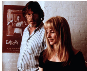
1989 NEW YORK STORIES (New York Stories) de Martin Scorsese avec Rosanna Arquette