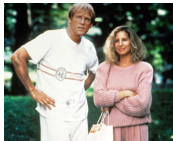
1991 LE PRINCE DES MARÉES (The Prince of Tides) de et avec Barbra Streisand