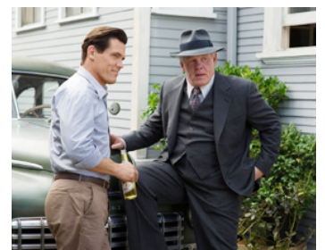
2013 GANGSTER SQUAD (Gangster Squad) de Ruben Fleischer avec Josh Brolin